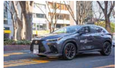
自動車学校のお申し込みも可能です