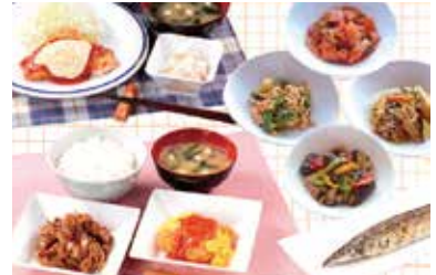
バラエティ豊かで栄養たっぷりの食堂メニュー