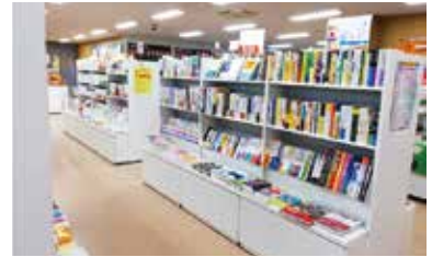
教科書・専門書を取り揃えています

東北大生協パソコン取扱ページ ▶ https://newlife.u-coop.or.jp/tohoku/standby/study/pc/